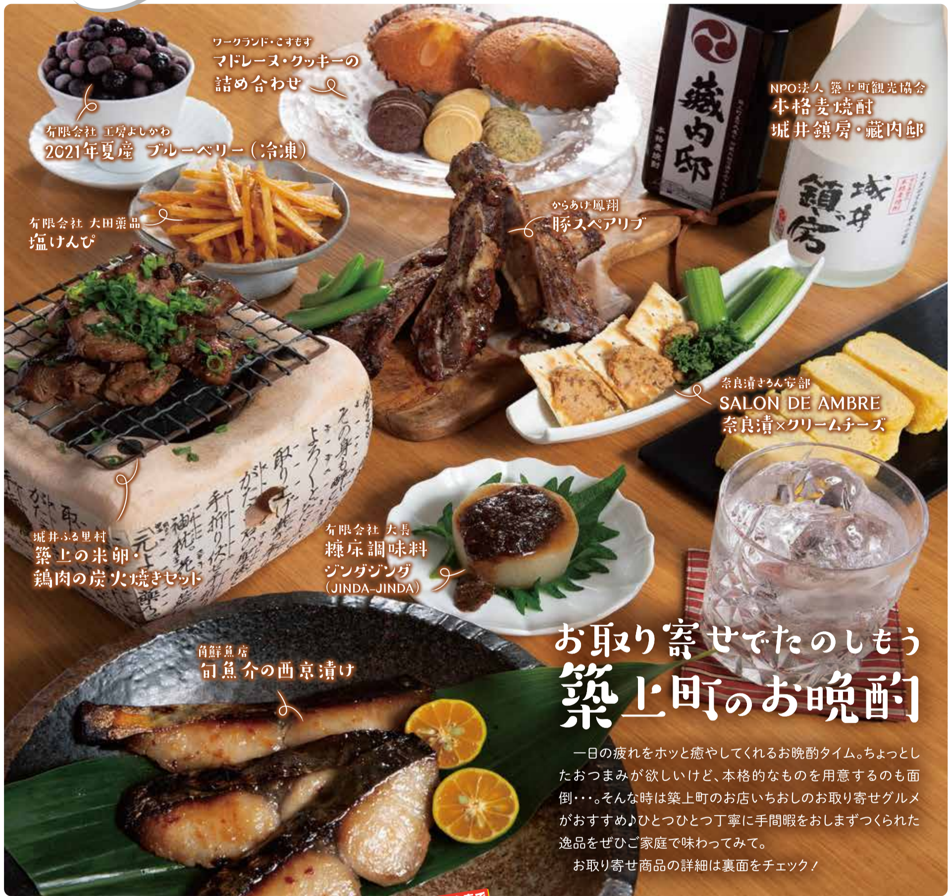
ワークランド・こすもす マドレーヌ・クッキーの 詰め合わせ

〒829-0301 福岡県築上郡築上町椎田1755 TEL: 0930-56-0353 伴走型小規模事業者支援推進事業